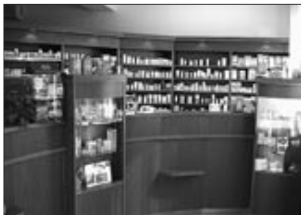
Výdejna léků sv. Alžběty