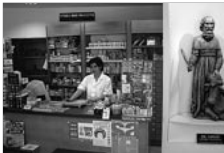
Lékárna sv. Lukáše