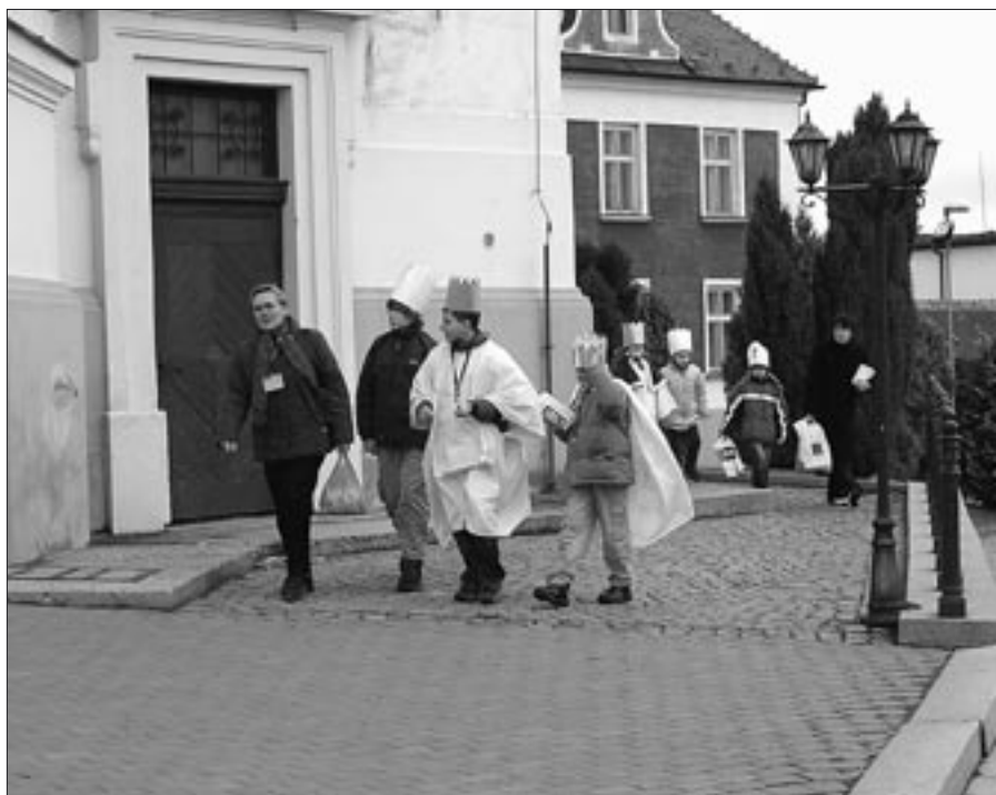
Fotografie z Tříkrálové sbírky

Tabulka neobsahuje informace o pomoci z Tříkrálové sbírky a adopci na dálku.